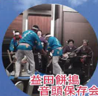
益田餅搗音頭保存会