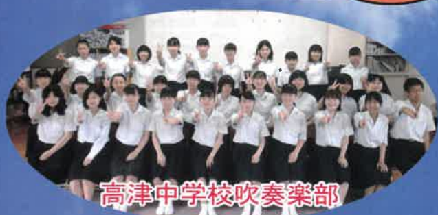
高津中学校吹奏楽部