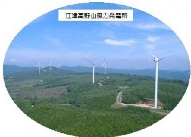
江津高野山風力発電所