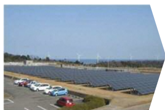
西部事務所と 太陽光発電所