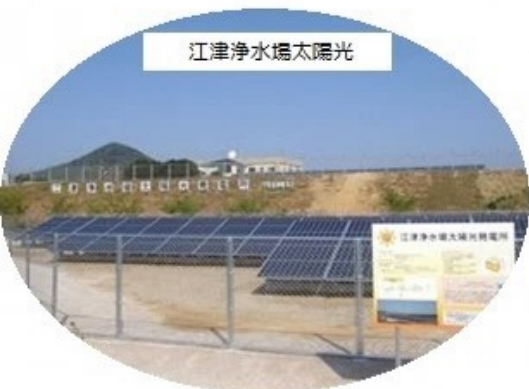
江津浄水場太陽光