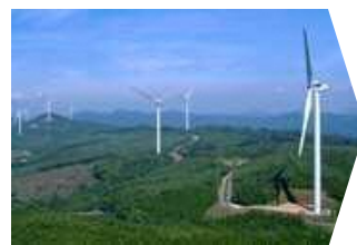
江津高野山 風力発電所