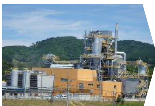
バイオマス発電所 他関連施設