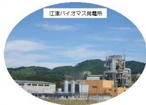
江津バイオマス発電所