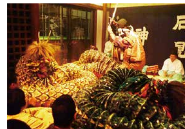
湯の町神楽殿 [Yu no Machi Kagura Den]