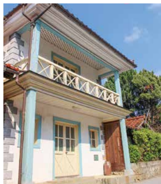
旧江津郵便局 [Kyū Gōtsu Yūbinkyoku] Ancienne poste de Gotsu

Domaine directement géré par le régime shogounal à l'époque Edo, Gotsu Honmachi s'est développé en tant que nœud de communication terrestre, maritime et fluvial. Les navires marchands kitamaebune reliant Osaka à Hokkaido en passant par la Mer du Japon y faisaient escale. Avec ses toitures en tuiles de Sekishū, et ses bâtiments historiques comme l'ancienne poste, datant de la fin du XIXe siècle, la bourgade a gardé son cachet d'antan.